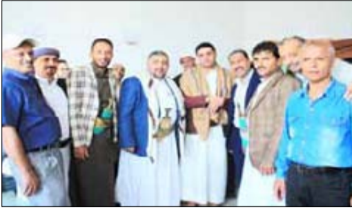
كتبت : أحلام الكافي

تفقد وزير الشباب والرياضة الأستاذ محمد حسين مجد الدين للؤيدي سير عمل موظفي الوزارة والصدق في أول أيام الدوام الرسمي بعد اجازة عيد الفطر المبارك.