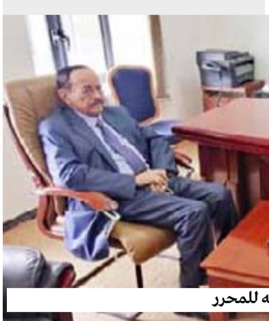
أثناء حديثه للمحرر

قوات الاحتلال في الجنوب فتحت أبواب المحافظات الجنوبية الشرقية على مصراعها للمتطرفين من عناصر القاعدة وداعش