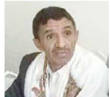
حاوره: علي العيسى

<< مهام مكافحة التهرب الضريبي هي مهمة مشتركة لجميع مسؤولي وموظفي المكتب والفروع ، كونها جريمة تمس الاقتصاد الوطني وتفتو على الدولة للبالغ المستحقة التي كان المفترض تحصيلها من جميع المكلفين للتهربين.