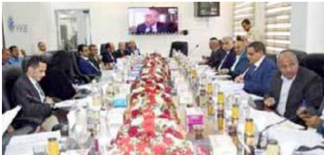
26 سبتمبر: خاص/

استطاع بنك اليمن والكويت ان يحافظ على ريادته في السوق المالية والصرفية اليمنية رغم العدوان والحصار الذي تعيشه بلادنا وكذا الانكماش الاقتصادي العالمي نتيجة تفشي فيروس كورونا.