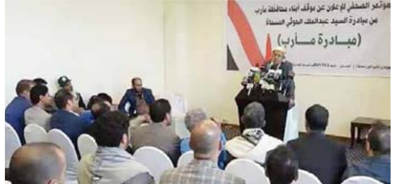
أعلنوا في مؤتمر صحفي الترحيب بمبادرة قائد الثورة بشأن المحافظة