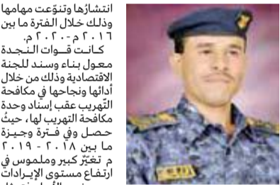
العقيد / محمد محمد الحوري

إن ما هو مُتعارفٌ عليه في واقع الثورات الشعبية، أنها تُبنى على منطلقات ثابتة وعوامل راسخة وأبجديات رسمت مسار الخط التوري؛ حيث كانت ثورة 21 من سبتمبر ثورةً انطلقت من شعب قوی الإرادة والعزيمة، صادقا في الولاء للقيادة القرآنية ولذا ظهرت بأهدأها ومراحلها كما وجدناها عليه، ثورة تستحق التضحية والضرب والنبات.