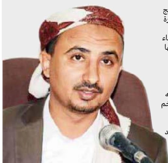
حاوره : نائب مدير التحرير

ننتهي إلى شخصية أعظم قائد عسكري عرفه الكون هو الرسول محمد صلى الله عليه وآله وسلم