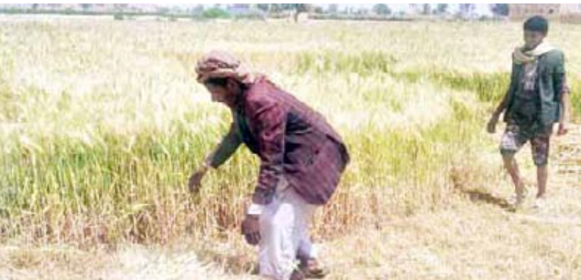
اعداد: رشيد الحداد

وضع الرسول الأعظم صلوات الله عليه وعلى آله للبشرية أسس حياة كاملة اقتصادية وسياسية وأخلاقية وإنسانية، فحتى اليوم تتفوق النظرية الإسلامية على النظريات الدنيوية الفكرية على النظرية الاقتصادية التي ارسها الرسول الأعظم، فقد وضع للإسلامية مجموعة من المبادئ والقواعد الثابتة التي تتلاءم مع مختلف الظروف والأزمات لأنها أصول لا تقبل التغيير والتعديل لإيها صالحة لكل زمان ومكان.