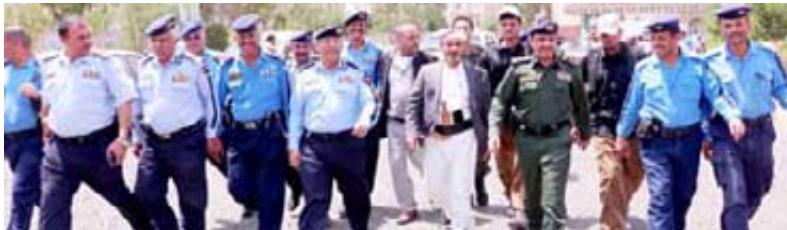
تغطية: أحمد تامش

« هذا القول غير صحيح لأننا بذلك سنخالف ما نص عليه قانون المرور بشأنها والضوابط القانونية التي تتخذ تجاه الدراجات النارية حال وقوع حادث مروري هي تلك التي يتم اتخاذها حال وقوع الحادث في غيرها من وسائل النقل الأخرى وحسب الخطأ الذي يثبت على سائقيها من خلال تخطيط الحادث وشهادة الشهود إن وجدوا.