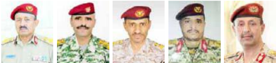
العميد الركن أحمد عبدالله السباني - قائد لواء النقل الخفيف تحدث قائلاً:

26 سبتمبر تواصلت مع قادة عسكريين وميدانيين لتسجل انطباعاتهم بهذه المناسبة الوطنية الغالية قوالى الحصيلة..