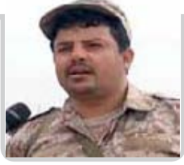
بقلم / اللواء عبدالخالق بدرالدين الحوثي