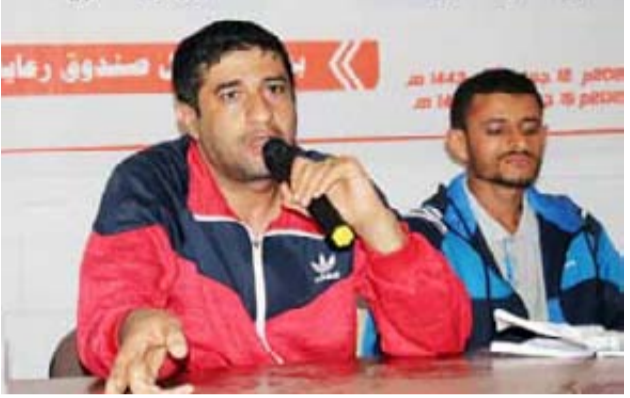
والذي نستذكر فيها عظمة تضحيات الشهداء التي قدموها والذين بدمائهم الزكية نرى النصر والصدور الأسطوري للشعب اليمني..

والانحراف وللوزارة في التوعية من مخاطر الخدرات والحشيش بالإضافة إلى الاهتمام بالشباب وتوعيتهم بالقضايا الدينية والوطنية وتفصيل الأنشطة الشبابية والرياضية المختلفة وتنفيذ مراكز الشباب الرياضية والتأهيلية والتدريبية وقد أطلقنا عدة أنشطة وبرامج وتوعية في هذا المجال منها برنامج شباب واع وعبر للنصبة الشبابية التابعة للقطاع وتنشد على أهمية دور الإعلام لأنه الأبرز في توعية الشباب بخطورة الحشيش والخدرات والحرب الناعمة..