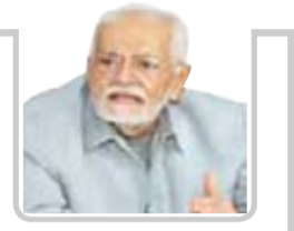
الدكتور/ عبدالعزيز التربي

عقدت اللجان الرئاسية للركزية لإعادة للمغرر بهم في محافظة الحديدة لقاء موسعاً اليوم بجامعة دار العلوم الشرعية برئاسة نائب رئيس الوزراء الدكتور حسين مقبول . والتنمية رئيس اللجنة الرئاسية الدكتور حسين مقبول . وفي اللقاء الذي ضم علماء وخطباء ومرشدي المحافظة أكد الدكتور مقبول أهمية الرسالة التي يمكن أن يقوم بها العلماء والخطباء ومرشدي المحافظة لدعوة للمغرر بهم للعودة إلى الصف الوطني . وأشار إلى أهمية دور العلماء والخطباء والمرشدين في توعية المجتمع والتشديد والتعبئة إلى الجهات للدفاع عن الوطن ضد كافة المؤامرات التي تحاك ضد الوطن . لافتاً إلى الحق المشروع لأبناء الشعب في الدفاع عن أمن واستقرار وطنهم ضد كل من تسول له نفسه للساس بهما . وأوضح مقبول أن دعوة للمغرر بهم للعودة إلى صف الوطن جزء أساسي من معركة الشعب اليمني ضد قوى الغزو والإحتلال . مشيراً إلى الجرائم التي يرتكبها العدوان ضد الوطن ويروح ضحيتها للثلاث من الأبرياء . فيما أشار عضو اللجنة الرئاسية وزير الصحة العامة والسكان الدكتور طه التنوكل ونائب وزير الإدارة المحلية قاسم الحمران إلى أهمية دور العلماء والخطباء والمرشدين في رفع مستوى الوعي المجتمعي في مواجهة العدوان بشي الوسائل . ولفت التنوكل والحمران إلى أن قوى الإحتلال ودول العدوان قد أسفرت عن وجهها القبيح في عدوانها على اليمن من خلال ما ترتكبه من جرائم كروعة على مدى