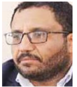
عبدالله بن عامر

تؤكد الأحداث الحالية أن العالم سيشهد المزيد من التقلبات على صعيد الصراعات بين القوى الكبرى وانعكاساتها على البلدان الأخرى، فخلال الأشهر المقبلة قد تبرز تحديات لها علاقة بالأزمة في أوكرانيا والرغبة الأمريكية في توظيف محاولات موسكو حسم الموقف عسكرياً خلال أقرب وقت وذلك في التمهد لحرب طويلة الأمد يخسر فيها الروسي ما حققه من رصيد عسكري واقتصادي خلال سنوات الصعود.