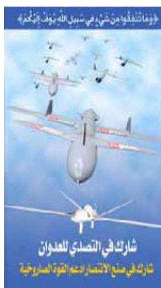
شارك في التصدي للعدوان شارك في صنع الانتصار لله القوات الصربية

أعلنت الإدارة العامة للمرور عن بدء حملة لإزالة ملصقات العاكس من على سيارات الأجرة، ابتداءً من 13 مارس الجاري. ودعت شرطة المرور جميع مالكي سيارات وباصات الأجرة إلى سرعة إزالة لواصق العاكس من على زجاج سياراتهم طواعية . وأكدت أنه سيتم اتخاذ الإجراءات القانونية اللازمة حيال المخالفين.