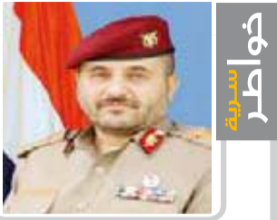
العميد عبدالسلام السياني