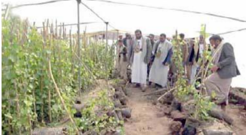
الجمعيات التعاونية الزراعية تساهم في التنمية الريفية وتحسين ظروف حياة المزارعين.