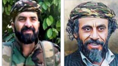
ولدت ويوم استشهدت ويوم يقوم الأشهداء.

أنا للجبهات ومكاني الجبهات ولن ابقى هنا.. قالها رافضاً البقاء بعيداً عن الجبهات