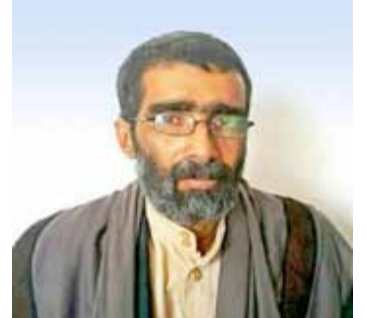
الشهيد القاضي حسن العنسي.. أ نموذجاً للشجاعة والإقدام

واستقلاله.. مؤكداً المضي على درب الشهداء والاهتمام بأسرهم عرفاناً بتضحياتهم في مواجهة قوى العدوان. فيما أشاد الزائرون للمعرض بتضحيات الشهداء في الذود عن الوطن وسيادته واستقلاله. كما أطلع المحافظ عوض واللواء الحاكم ومعهما مدير فرع هيئة رعاية وتأهيل أسر الشهداء بالمحافظة عبدالله الكستيان، على مدرعة الشهيد الفدائي هاني طومر ضمن محتويات المعرض.