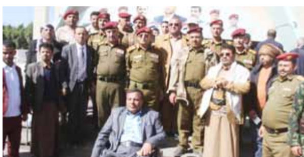
لا يمكن أن تؤثر عليه مخططات ومساعى الاحتلال. وأشاد بدور أبناء المناطق الجنوبية الذين كانوا

وأكدوا أن الشهيد الصمد رحمه الله مثل قدوة في القيادة للسهولة والبذل والتضحية والفداء في سبيل الله والوطن.