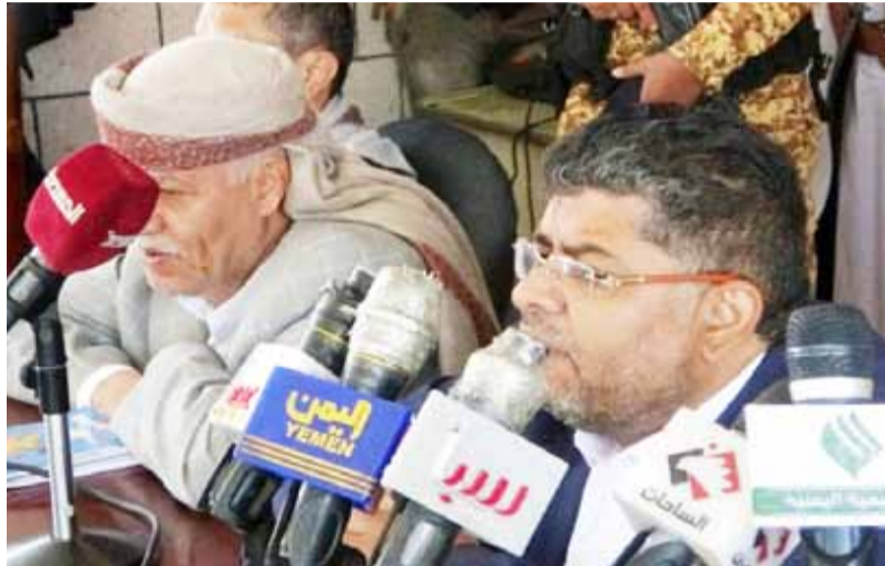
لغرض العلاج.. مؤكداً على ضرورة استئصال الجميع للمسؤولية في خدمة الوطن والمواطنين والإسهام الفاعل في عملية البناء والتنمية والنهوض بالوطن. وأضاف " نفتخر بأبناء إب وبدورهم المشرف في معركة الدفاع

حضر اللقاء وكالة المحافظة، وقيادات محلية وتنفيذية وأمنية وشخصيات اجتماعية.