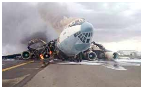
خاص : 26 سبتمبر

كثير من المستوردين إلى خسائر كبيرة جراء عدم تمكنهم من شحن وادخال البضائع التي تعاقداً على استيرادها ودفعوا قيمتها للشركات الأجنبية والتي كان بعضها في موانئ التصدير وجاهزة للشحن والبعض الآخر تم شحنها وهي في عرض البحر والبعض الآخر وصل إلى قرب الموانئ ولم يسمح لها بالدخول إلى الموانئ اليمنية وظلت لفترة طويلة هناك مما عرضهم لخسائر كبيرة تمثلت في دفع تكاليف وغرامات التأخير وبعض من هذه البضائع كانت حساسة وظلت لفترة طويلة في موانئ التصدير مما عرضها للتلف.