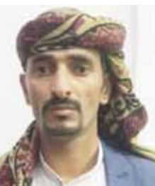
الشيخ/ ماجد النصيري