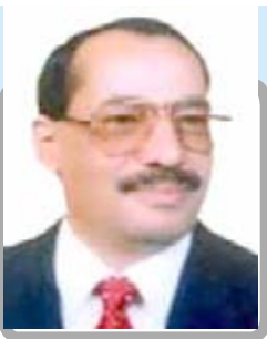
أ.د عبدالله الفايلى #