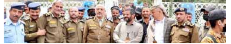
خلال زيارته لمعرض الشهيد القائد بدمار

هذا وكان قد توجه إلى سويسرا، يوم الخميس الماضي، وفد اللجنة الوطنية لشؤون الأسرى برئاسة رئيس اللجنة عبدالقادر الرضى للمشاركة في جولة جديدة من المفاوضات على ملف الأسرى، حيث أعرب رئيس اللجنة الوطنية لشؤون الأسرى عن أمله في أن تكون جولة المفاوضات الجديدة في جنيف برعاية أممية حاسمة للملف الإنساني.