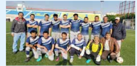
وعلى ملعب نادي وحدة صنعاء حسم فريق كلية الطيران بطاقة التأهل بعد فوزه