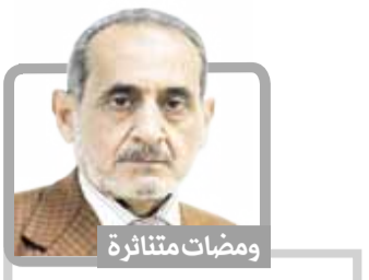
ومضات متناثرة احمد الفقيه

السيد القائد عبدللح حفظه الله - لا يعلمه من أهمية دور خطباء المساجد في الحث على فعل الخير حرص أن يعقد معهم اجتماع خاص ليحثهم على توعية المجتمع في كل شؤون الحياة مع التركيز على فعل الخير والإحسان، كما أوصاهم بعدم التطويل للمل حرصاً منه أن تصل للوطة بما قل ودل من الحديث، تأمل من ساداتنا وعلماتنا خطباء المساجد هذه الأيام بطرف صعبة وحرحة فإن واجب خطباء المساجد أن يثروا المجتمع على فعل الخير والإحسان..