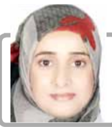
كاتبة يحيى السني - كندا

أنها تضلل في حرف سفبان وأبين على حد سواء بمبالغ كبيرة من الأموال المتداولة أدت إلى تخلي العديد من الوسطاء عن دورهم من التمسك بالبلاد في السنوات السابقة، في 3 مارس 1994م نشر سنان أبو