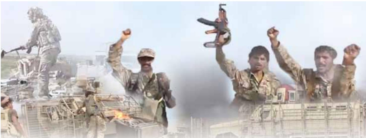
قادة عسكريون وأمنيون يؤكدون لـ ٢٦ سبتمبر :