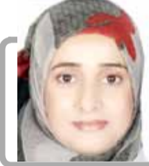
ترجمة: كاتبة يحيى السني - كندا

قد توقف في الجنوب بناءً على أوامر من الرئيس وقد عليه عمر الجاوي ومع ذلك كان الوجود لليمن شوق آخر للنهب وعلى الرغم من أن الحرب لم تكن بين الشمال والجنوب بل كانت بين الأحزاب بشعر الجنوبيين الأمن السياسي في أعز شمالي وكان هناك كتيب مشهور متداول في الجنوب بعنوان "من جنوب اليمن"