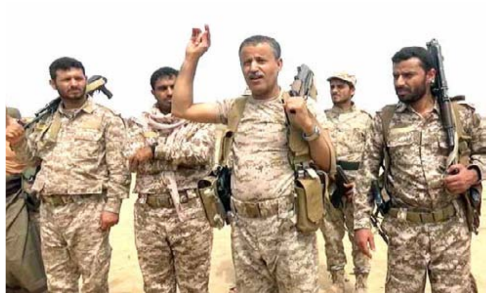
زار منتسبي اللواء 82 مشاة في خطوط التماس في جبهة ميدي: