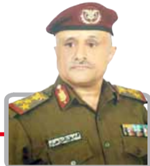
العميد الركن: نجم عباد

في المنطقة. بالتالي معسكر العدوان بقيادة واشنطن بعد ثمانية أعوام من الحرب وتلقي الخسائر دخل حالة يأس وقناعة بالهزيمة في المواجهة وهناك تسليم شبه كلي بالفشل العسكري وقد أصبح يعيش وأقع الردع والضغط التي تفرضه القوات المسلحة اليمنية بفضل الله تعالى اليوم لاسيما الردع الذي أدى إلى إجباره على إيقاف العمليات العسكرية والذهاب للتهدة والهدنة والامتناع من نهب الثروات النفطية السيادية.