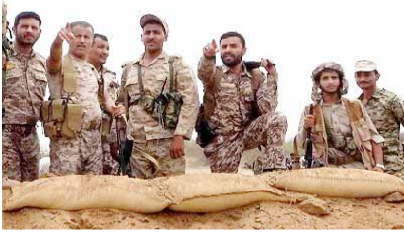
معركة التمكن والفتح المين

جبهة ميدي أذقت العدوان مرارة الهزائم وماتزال جثث مرتزقة متناثرة في صحراء ميدي هزمتنا أكبر آلة عدوانية.. وسنجرر أرضنا اليمينية شبرا شبرا وزير الدفاع مخاطباً المقاتلين: سنكون سنداً لكم ونمدكم بالإمكانات وبدماثنا