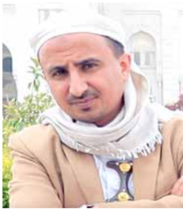
حاوره: هلال جزيلان

كلفة الحجة الواحدة، تأخذ ما يقارب 20 ألف ريال سعودي، أي أنها ارتفعت ثلاثة أضعاف ما كانت عليه قبل العدوان، ويقابل هذه الزيادة تردى في الخدمات، فعمل سبيل المثال تم استئجار سكن للحجاج هذا العام بعيداً عن الأراضي المقدسة، ويبعد ذلك السكن عن الحرم لكي لا يقرب عشرة كيلومترات، فيحتاج الحجاج ليصلوا فريضة في الحرم لكي لا يقرب عشرة كيلومترات، إضافة إلى جمع البنين، كلهم في سكن واحد، وهذا الأمر يعرضهم للخطر، والاستهداف من قبل السلطات السعودية، كما تلاعب الزفزة بعدد الحجاج من المحافظات الحرة، لصالح الحجاج من المحافظات المحتلة، كان تقوم بتحويل عدد أكبر للوكالات العاملة