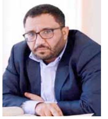
عبدالله بن عامر

ضمن استراتيجية بريطانية في السيطرة على الركن الجنوبي الغربي ، كان التركيز على السيطرة على تعز إما بشكل مباشر أو غير مباشر أحد أبرز أهداف تلك الاستراتيجية المتعددة التي لا تقتصر على عدن بل والبحر الأحمر وباب المندب هذا ما اشار اليه الباحث عبدالله بن عامر في نهاية الفصل الثاني من كتابه " تقسيم اليمن.. بصمات بريطانية" إضافة إلى أساليب بريطانيا في إذكاء الصراع بين اليمنيين تحت مسميات عدة منها المناطقية والمذهبية بهدف تحقيق اهدافها في الاحتلال والتقسيم .. إلى تفاصيل الموضوع كما أورده الباحث :