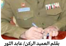
بقلم العميد الركن/ عابد الثور

أعتمد قائد الثورة على ما تمتلكه البلاد من إمكانات عسكرية وأهمها أولئك القادة الذين كانوا في القوات المسلحة وضربوا أروع الأمثلة في الإخلاص والوفاء وحب الله والوطن فوققوا وقفة رجل واحد مع أخوانهم القادة من اللجان الشعبية وشكلوا قوة واحدة تحت قيادة قائد الثورة فكانت هذه بمثابة صدمة للمرتزقة والخونة والعملاء والذين التحقوا بصفوف العدوان في السعودية والأمارات وبالخبارات الأمريكية والبريطانية.. فكانت هذه نقطة تحول كبيرة في حياة القادة والمقاتلين.