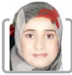
ترجمة: كاتبة يحيى السني - كندا

التقاليد العربية وليس بحدود الدول القومية هذه الحدود هي نتاج القرن الحالي اليمن الحقيقي بالنسبة للكثيرين (وصف الأعراف الشريفة) ولا سيما لكثرة من القبائل هناك تسمى حاشد وبكيل وهذه القبائل مهمة في شبه الجزيرة العربية عندما تلقى اليمن نفسها إشارة متكررة جداً في الصحافة الغربية سواء كموقع اكتشاف نفطي كبير (1984م) أو كنقطة إستراتيجية على الضائق التي تربط البحر الأحمر بالمحيط الهندي في مثل هذه الروابط عادة ما يتم ذكر القبائل أيضاً لكن اهتمامهم الإثنوغرافية أعمق بكثير من الشؤون الحالية لقد كانوا في مكانهم الحالي منذ بداية العصر الإسلامي على الأقل في الواقع كانوا بارزين في صعود الإسلام نفسه وكان رجال القبائل دائماً مُنذ ذلك الحين بارزين في تاريخ اليمن الهدف من هذا الكتاب هو الجمع بين التاريخ والإثنوغرافيا لإظهار ليس فقط نوع الهوية التي تشكلها القبائل لنفسها على مدى فترات طويلة كهذه ولكن مكانها في العالم المعاصر ومع ذلك لا تزال البلاد غير معروفة كثيراً لدرجة أن المخطط الأول للأشخاص والأماكن يستحق تقديمه كرسم تخيبي للجغرافيا للمادة واللغاهيمية، حتى وقت قريب تميزت اليمن عن بقية شبه الجزيرة بالسلاسل الجبلية ومكانتها في