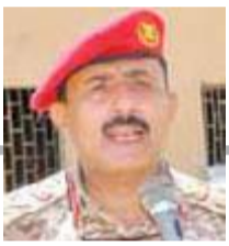
اللواء: عبدالرزاق الويدي*