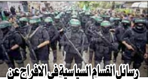
رسائل القسام السياسية في الإفراج عن الأسيرات الإسرائيلية والأمريكية

بهكذا فعل، فالآن الصهانية، وخاصة أهالي الأسرى المحتجزين سيقولون، إنما هبت لإطلاق سراح رعاياها أما أبناءنا فما فترتهم ننتباهو ويصفف الآن في غزه وربما يقبضوا تحت هذا القصف، هذا الأمر سيجعل الصهانية، في ريب مما يجري من حرب، على غزه وقد يضغطون على انتباهنا.