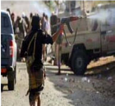
إحراق الانتقالي للدراجات.. محتجون غاضبون يقطعون طرق رئيسية في عدن

شهوة اليوم الثاني على التوالي هزت انفجارات عنيفة معسكراً تابعاً لها وكانت مصادر اعلامية تحدثت أن للاحتلال الإماراتي وكانت مصادر اعلامية تحدثت أن خمسة انفجارات هزت معسكراً مرمياً الاستراتيجي في مدينة عنق عاصمة محافظة شبوة المحتلة، مبنية أن معسكراً يضم عدداً كبيراً من قوات الاحتلال الإماراتي وميليشيا ما يسمى "دفاع شبوة"، وأشادت المصادر العسكرية بمتانة تحصينات معسكراً صاروخي استهدف معسكراً للاحتلال حيث سمع دوي الانفجارات في مناطق عدة بمدينة عنق.