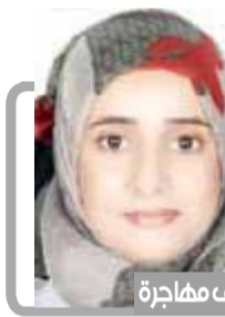
كاتبة يحيى السني - كندا

لطف الهجرة الذي مرّ علينا سابقاً له أكثر من معنى أو توصيف ومنها ما يضم مجموعة من رجال القبائل وغيرهم وبعض رجال الدين الذين تمخضت هذه القبائل والأماكن التي يعيش فيها هؤلاء مثل القرية والنازل والأسواق أو أي تجمع سكاني يضم مئات أصول متعددة تجمعوا في منطقة واحدة ويجمعهم قانون يسمى سلام البيت أو السلام الذي يحدد حدود القبيلة، الفكرة الكامنة وراء هذه المصطلحات ذات أهمية عامة لكن السادة الذين يعيشون تحت الحماية القبلية يتناسون أيضاً مع نموذج معين من ما تعتبر العائلة المقدسة أو الجيب المقدس للربط بها والذي تم تطبيقه على تاريخ الإسلام المبكر وربطه بمؤسسات ما قبل الإسلام في جنوب شبه الجزيرة العربية أما كعنى آخر للهجرة فهي ما حدث في صدر الإسلام بالطبع انتقال النبي من مكة إلى المدينة في اليمن القديم يشير مصطلح حجر في اللغة القديمة والتي تعني اللاد الأمن إلى ملاذ يوضع فيه عادة آلهة الجماعة الحامية أو المجموعة الشبيهة بالقبيلة، إن ربط مصطلح الهجرة بالهجرة الإسلامية المبكرة أمر يؤخذ بعين الاعتبار على الرغم من أنه لا يمكن إثبات أي صلة تاريخية بين الأثن كما أن ربط كليهما بالهجرة الأخيرة في اليمن العلوي لا يزال أكثر قبولاً لذا يجدر التأكيد على أنه من الناحية الإثنوغرافية إن الجيب المقدس ليس سوى نقطة ثابتة واحدة في العالم القبلي من بين العديد من النقاط