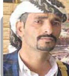
الشيخ ماجد النصري

الحساسية لكبان الاحتلال لتدكها وتدمرها وثبت العرب في نفوس قادة وحجود جيشه.. بل يستمر في استفاد من نفوقه من شن عدوانه على الشعب الفلسطيني وقتله للأبرياء فلن يتردد شعبنا العزيز والكريم لحظة واحدة من حظر مرور السفن الإسرائيلية البحر الأحمر وضيق باب اللند بشكل كامل أمام وسفن كل من يقف معه ويدعمه من أنظمة الغرب التريص العنصرية والإسلام وبالقدسات الإسلامية.. وما ذلك على الله