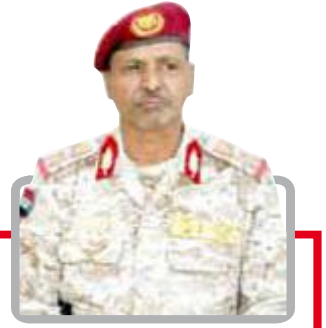
اللواء الركن / صالح محمد معيوف

** لأرض من أعظم الهام والواجبات الدينية والوطنية هي الدفاع عن الأهل والعرض وهو ما يستدعي منا جميعاً الوقوف بإجلال وإعزاز وتقدير لتلك التضحيات والآثار البطولية التي يقدمها رفاق السلاح من الأبطال في القوات المسلحة والأمن الذين بذلوا أرواحهم وأنفوسهم في سبيل الله وعزة وكرامة الشعب اليمني الحر الصامد، ومن أجل التضحيات فالشهادة هي التجارة الربحية مع الله.