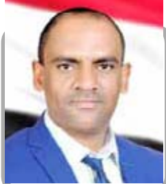
اللواء/ هاشم سعد بن عايود السقري #

كلمات مضيئة: كتب إلى رسالة قال فيها: كلا لا يهمني إطلاقاً على المستوي الشخصي ما يقوله عن الآخرين ولا تعني الصورة التي يبرسونها.. إنما يهمني على المستوي العام ألا تكون ثقافة المجتمع التي انتمى إليه ثقافة الجمل والكراهية والتعصب الأعمى والأباطيل والأقوابيل والافتراءات.. "أدونيس"