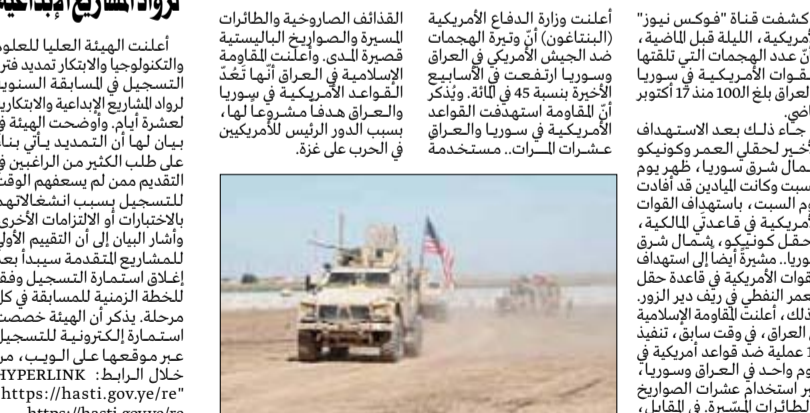
أعلنت وزارة الدفاع الأمريكية (البنتاغون) أنّ وتيرة الهجمات ضد الجيش الأمريكي في العراق وسوريا ارتفعت في الأسابيع الأخيرة بنسبة 45 في المئة، ويُذكر أنّ المقاومة استهدفت القواعد الأمريكية في سوريا والعراق عشرات السرات. مستخدمة القاذفات الصاروخية والطائرات المسيرة والصواريخ الباليستية قصيرة المدى. وأعلنت المقاومة الإسلامية في العراق والفرق العراقية والقواعد الأمريكية في سوريا والعراق هدفاً مشروعاً لها، بسبب الدور الرئيس للأمركيين في الحرب على غزة.