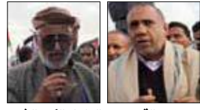
حامد: القدس هو العنوان الكبير الذي اعتسرنه قضيتنا

مسيرة جماهيرية مليونية كبيرة في العاصمة صنعاء بميدان السبعين، انتصارا للدم الفلسطيني، وتأييدا للمقاومة، في غزة، بعد اليوم السابع من بدء الحرب، وأخوتنا في فلسطين والقطاع يعانون كثيرا، وعلى هامش الفعالية والمسيرة قرأت 26 سبتمبر التالية:-