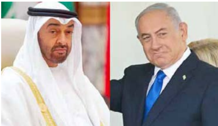
تضييق الخناق على اقتصاد كيان العدو

تضاعف تأثيرات الحصار البحري وحول الحصار البحري الذي تفرضه القوات المسلحة اليمنية على موانئ كيان الاحتلال الصهيوني ، أشار نائب مدير دائرة التوجيه المعنوي العميد عبدالله بن عامر إلى أن رسوم التأمين على السفن "الإسرائيلية" في البحر الأحمر ارتفعت بنسبة 250% وبعض شركات التأمين ترفض التعامل مع هذه السفن . وقال "للمفت أن تاولات الإعلام الإسرائيلي وكذلك الغربي تتجاهل وبشكل متعمد أسباب التحرك اليمني بهدف تضليل العالم وحتى لا يدرك الجميع أن المشكلة ليست في اليمن بل في كيان الاحتلال واستمرار عدوانه وحصاره على قطاع غزة" وأوضح بن عامر أن السفن الحربية الأمريكية والبريطانية تدافع عن إسرائيل من البحر والإمارات والسعودية تقدم لإسرائيل البائل من البر .. مضيفاً "نعم البائل البرية غير عملية مقارنة بالشحن البحري لكن يكفي أن يسجل التاريخ أن اليمن يحاصر إسرائيل من أجل غزة وأن دولة عربية تساند إسرائيل لكسر الحصار اليمني" .