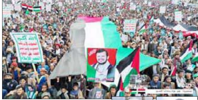
حازب: أقل واجب نقدمه مع أخواننا في غزة هو الوقوف خلف جيشنا وقواتنا المسلحة