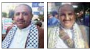
الصنعاني: نفخر بالخروج الحافل في كل المحافظات الحرة مع غزة حتى النصر

التنفيذ لمنظمة "يمن فلسطين"، الأمين العام للاتحاد اليمني لمنظمات المجتمع المدني، من جانبه، قال إن خروجنا اليوم في هذه المسيرة المباركة يأتي تأييدا، للعمليات التي تقوم بها قواتنا المسلحة، كالقوة البحرية والصاروخية والطيران السري، من عمليات انتصار وتأييد للمقاومة في فلسطين، ودماء الشهداء في غزة، إن الشعب اليمني اليوم خرج بكل مكوناته، ليقول للعدو الصهيوني إن جرائمكم ستكون نكالا عليكم، كما أننا بهذا الخروج أقل ما يمكن عمله للانتصار لأطفال غزة، التي تواجه وحدها، وتبكي وحدها وتموت وحدها، دون أن يحرك أحد ساكن، وهذا بعد كارثة في إنسانية للتابعين الصامتين، من عرب مطيعين، وغرب منتصرين للكيان الصهيوني.