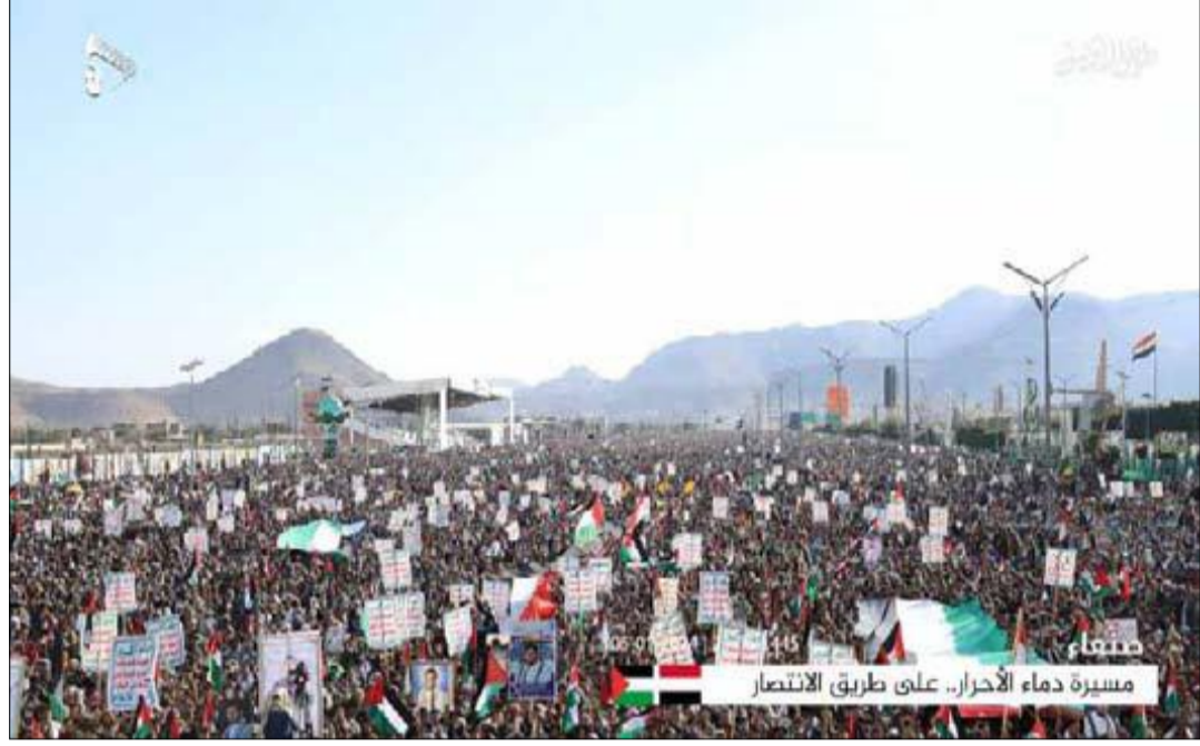
مسيرة دماء الأحرار.. على طريق الانتصار

تجدد الإشارة إلى أن الطوفان البشري (دما شهداء البحرية.. على طريق الانتصار) هو الـ 13 الذي تشهد العاصمة صنعاء