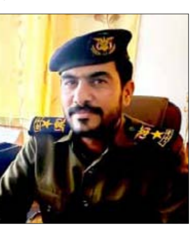
عمليات القوات المسلحة ضد الكيان الصهيوني مصدر فخر واعتزاز الأمة العربية والإسلامية

الشعب اليمني هو الوحيد الذي لا يزال يتفق مع القضية الفلسطينية قولا وعملا وسط تناقض وتخاذل الأنظمة العربية التي أظهرت انبساطها وعمالتها للكيان الصهيوني، ونحن في زمن كشف الحقائق جراء للجزائر الوحشية التي يتعرض لها أبناء قطاع غزة للشهر الثالث على التوالي. ومع التهديدات التي يتعرض لها بلادنا مازالت تقابل بتجدي أبناء الشعب الذي لا يزال يخرج للميادين والساحات معلنا استعدادهم لخوض غمار مواجهة تحالف حماية السفن الإسرائيلية بعد مواجهة تحالف العدوان طيلة 9 سنوات من الحرب والحصار على اليمن.