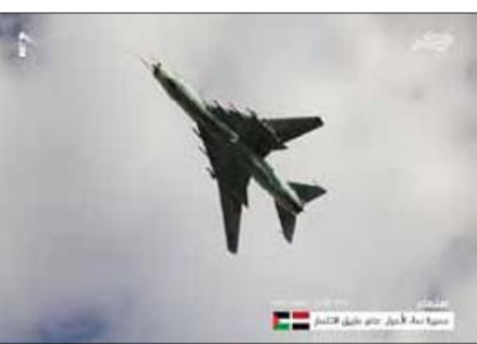
مسيرة دماء الأحرار.. على طريق الانتصار