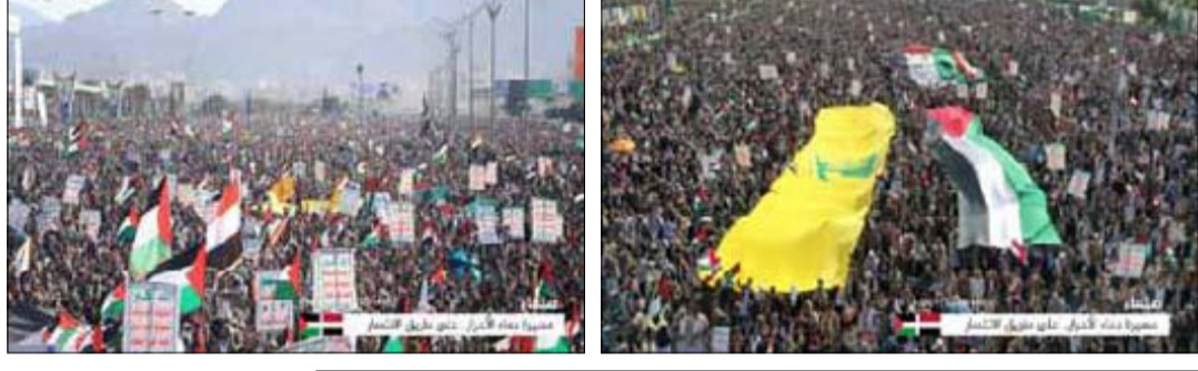
مسيرة دماء الأحرار.. على طريق الانتصار