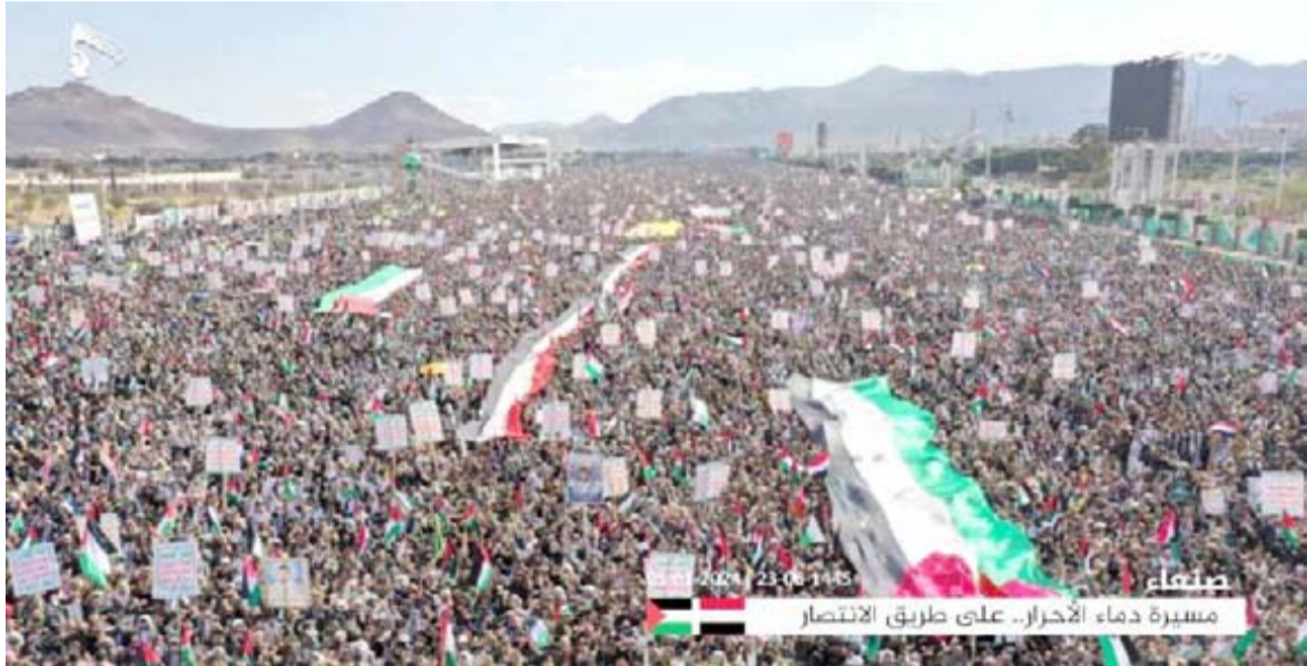
الرسالة التي أرسلها أبناء شعبنا من خلال المسيرة المليونية بأن الشعب سيظل مناصرا ومعينا لغزة حتى النصر

القوات المسلحة اليمنية ضد الكيان الصهيوني، ومنها ما تقوم به القوات البحرية اليمنية من حماية للمياه الإقليمية ومنع السفن الإسرائيلية والتوجهة إلى اللواتي الفلسطينية المحتلة من الزور في البحر الأحمر وباب النوب، كما تعلن القبائل اليمنية جهوزيتها لمواجهة أمريكا وإسرائيل العدو الحقيقي، والذي طالما انتظرنا هذا اليوم، وتعلن القبائل اليمنية النفر العام، والاستعداد لردف الجبهات والمقاتلين، ودعم القوات البحرية والبحر الأحمر والمال والسلاح، وتؤكد وقوفها الدائم مع إخواننا في فلسطين، وأن معركتنا اليوم هي مع العدو الحقيقي أمريكا وإسرائيل، وأن تحالفهم لن يخيفنا ولن يثنينا عن مواصلة دفاعنا عن أبناء غزة، بل أن هذا التحالف الأمريكي يريدنا عزيزة وإصرارا على مواصلة جهادنا ضد الشيطان الأكبر أمريكا وإسرائيل، حتى تحقيق النصر وتحرير كافة الأراضي العربية المحتلة.