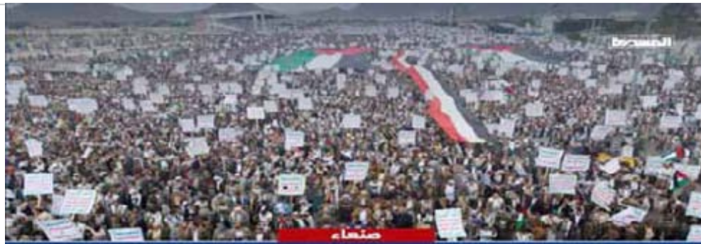
مسيرات " ثابتون على الموقف.. مع غزة حتى النصر "

وأكدوا أن استمرار العدوان الأمريكي البريطاني على اليمن لن يثني الشعب اليمني عن موقفه المساند والداعم للشعب الفلسطيني.. منددين