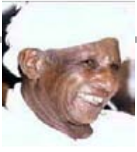
الشاعر والأديب / عبدالله الطيب