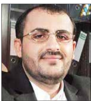
للضغط الأمريكي والضغط على اقتصاد البلد خدمة للعدو الإسرائيلي. وقال السيد: "أوجه النصيح للسعودي

ليحذر من الإيقاع به من قبل الجانب الأمريكي خدمة للعدو الإسرائيلي فاستهداف البنوك في صنعاء عدوان في الجبال الاقتصادي، وإذا تورط سعودي خدمة لإسرائيل سيقع في مشكلة كبيرة، وأضاف: "السعودي غنى عن الشاكر، ولماذا يقدم نفسه وإمكاناته ليتجنّد في خدمة العدو الإسرائيلي؟". وأوضح أن من الضلال أن يخسر البعض أمنه وسلمه وكل شيء من أجل العدو الإسرائيلي وأضاف: "يحذر من الخطوات الداعمة للعدو الإسرائيلي ضد بلدنا بدون وجه حق و أي خطوات عدائية على بلدنا لن نتبنها عن موقفنا الساند لغزة، حتى لو اتجهت بعض الأنظمة العربية للقتال خدمة للعدو الإسرائيلي"، مؤكداً أننا سنبقى من موقفا الإيماني الجهادي لنصرة الشعب الفلسطيني، ولن يردنا أحد عن هذا الموقف.